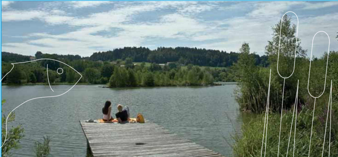
Innehalten und in malerischer Umgebung mit der Seele baumeln