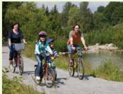
Radeln, Joggen, Wandern – hinter jeder Wegbiegung wartet ein neues Abenteuer

Über die Brücke des Reichermühlbachs führt der Weg zum Themengarten „Granit“, der die Schönheit des Steins beleuchtet, auf dem der Bayerische Wald fußt. Kinderspielplatz mit Rutschturm, Einblicke in die Welt der Bienen, Kneippanlage mit Tret- und Armbecken – im Kurpark sind verschiedene Attraktionen für Junge und Junggebliebene leicht und auf kurzen Wegen erreichbar. Das Herzstück ist der Kurpavillon mit der Seebühne, der Natur, Kur und Kultur auf erfrischend anregende Weise miteinander verbindet.