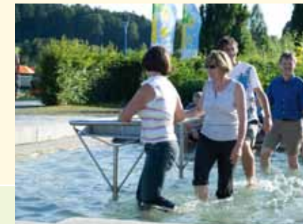
Schritt für Schritt Entspannung und Gesundheit