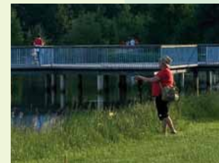
Barrierefreie und familienfreundliche Wege machen die Natur erlebbar